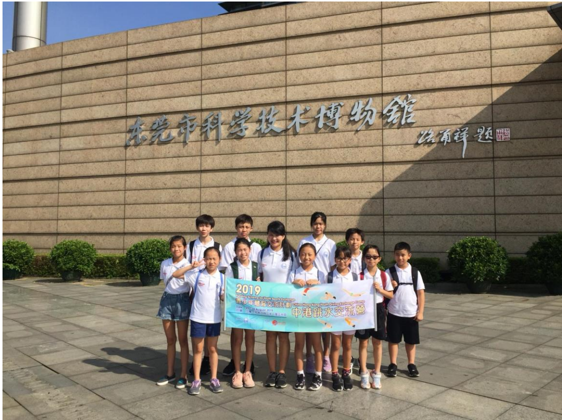
參加者於博物館門前拍照留念